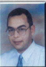
د. أحمد خالد توفيق